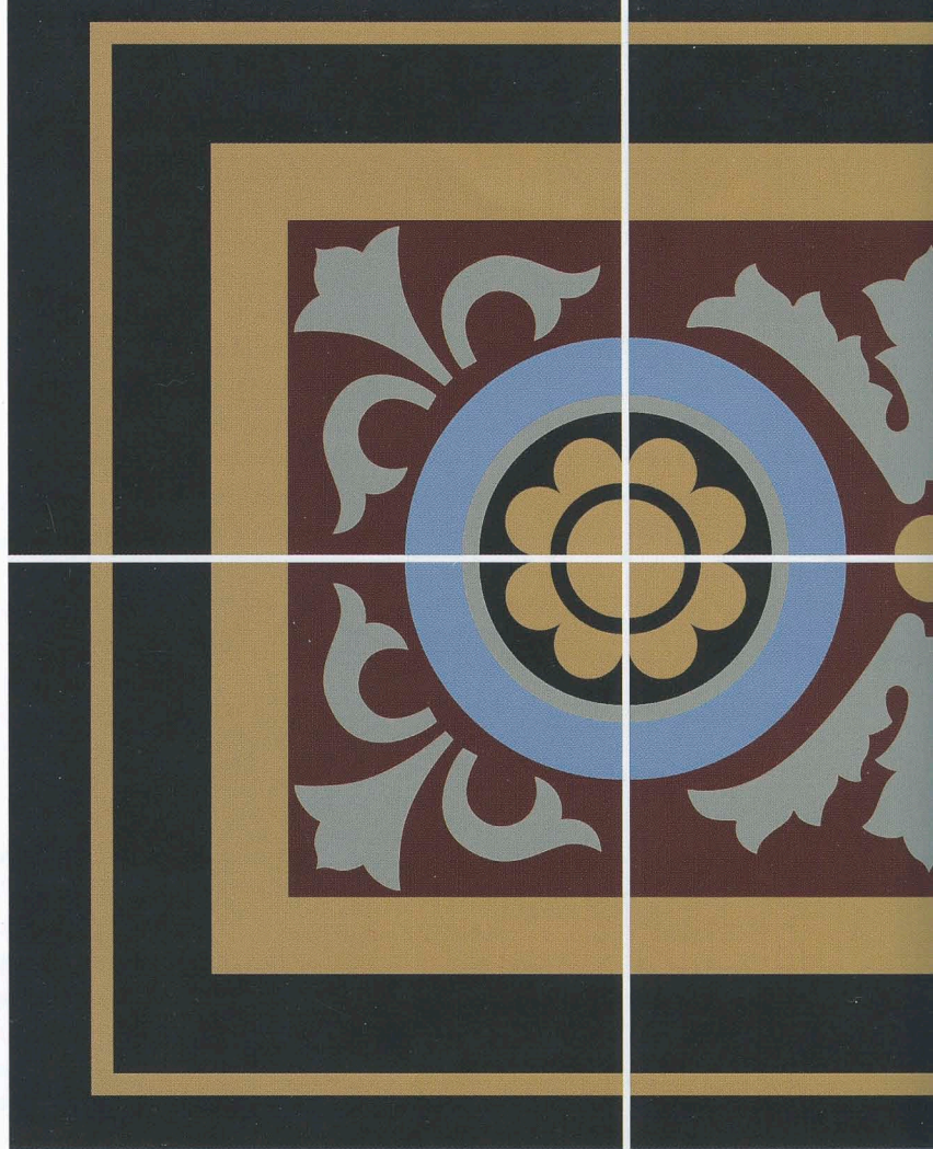
Een zeefdruk van SDL Produkties.

Op een klein bedrijventerrein in Westerhoven staat het bedrijfspand van SDL Produkties. In het atelier staan verschillende drukpersen. Daarnaast is een kantoor en daarboven een kleine showroom. Deze is gevuld met serviezen, vazen en... tegels. "We worden regelmatig benaderd door kunstenaars en ontwerpers die onze hulp zoeken bij de uitvoering van hun ideeën", vertelt Ellen de Leuw. Op die manier zijn er al veel tegels in openbare en publieke ruimtes terechtgekomen met een opdruk of print van SDL Produkties. Maar Stef en Ellen de Leuw hebben eigenlijk liever dat ze eerder bij een project worden betrokken. "Als we al in de schetsfase mogen meekijken, kunnen we eventuele problemen van tevoren tackelen, beter sturen en op de klant anticiperen. Dat levert een completer eindresultaat op", aldus Stef. Een goed voorbeeld daarvan is het project VOC Cour Westerdok in Amsterdam. Voordat dit appartementencomplex gebouwd werd, is er in de bouwput archeo-