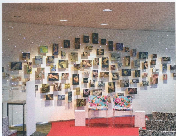
Het kunstwerk van Jeroen Krabbé in de trouwzaal van Dalfsen bestaat uit tegels met een print van handen uit de kunstgeschiedenis.